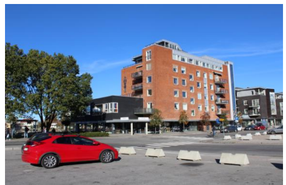
Etter Sjømannshjemmets brann ble Hotell Neptun bygget for erstatningen. Etter salget av Neptun er også denne institusjonens midler lagt i Sjøfartens Hus.