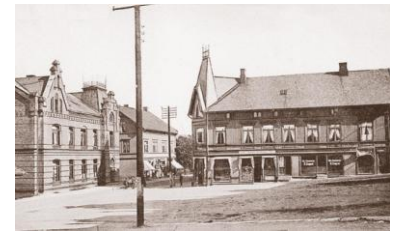
Meieritorget, Sjømannshjemmet til v.

Det kan vi love, - og med all interesse og velvillighet fra byen, fylket og Sparebank 1 Telemark gjennom rause bevilgninger til byggingen av Tollbugata 23, så har vi nådd målet hva bygningen gjelder.